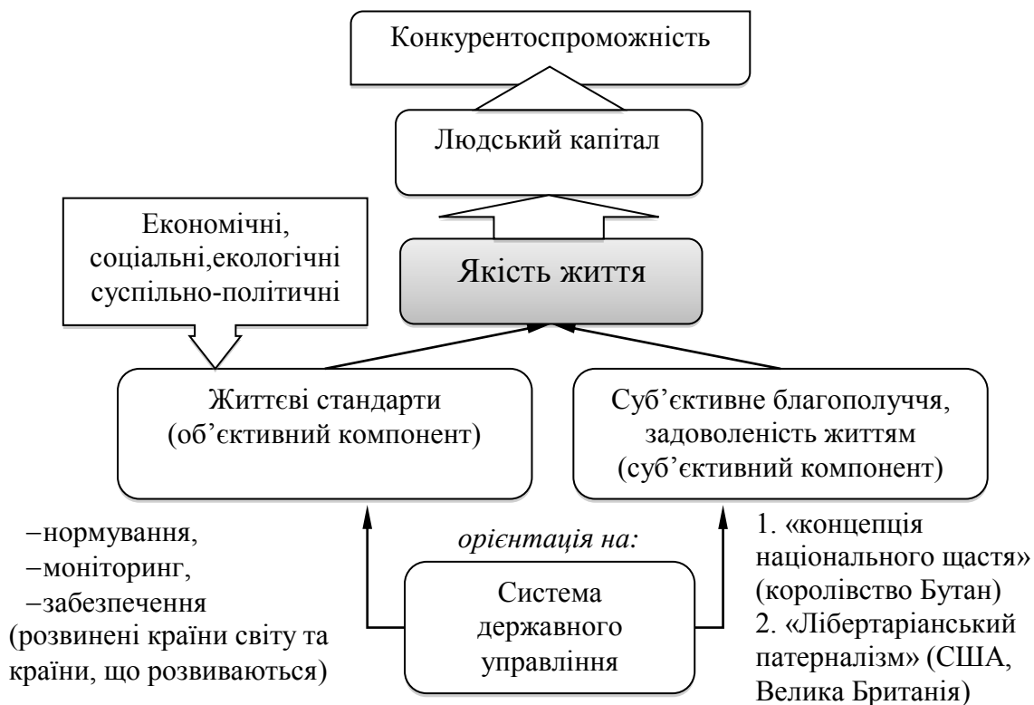
Рис. 1. Якість життя: базові компоненти

Досліджено, що поняття «якість життя» перетинається з поняттям «життєві стандарти». Також воно має відношення до поняття «людського капіталу». В українській традиції під «стандартами» розуміється той мінімальний обсяг споживчих благ (послуг), яке суспільство (держава) гарантує кожному його члену, що виражається у показниках споживчого кошика і мінімальних трудових і соціальних виплатах.