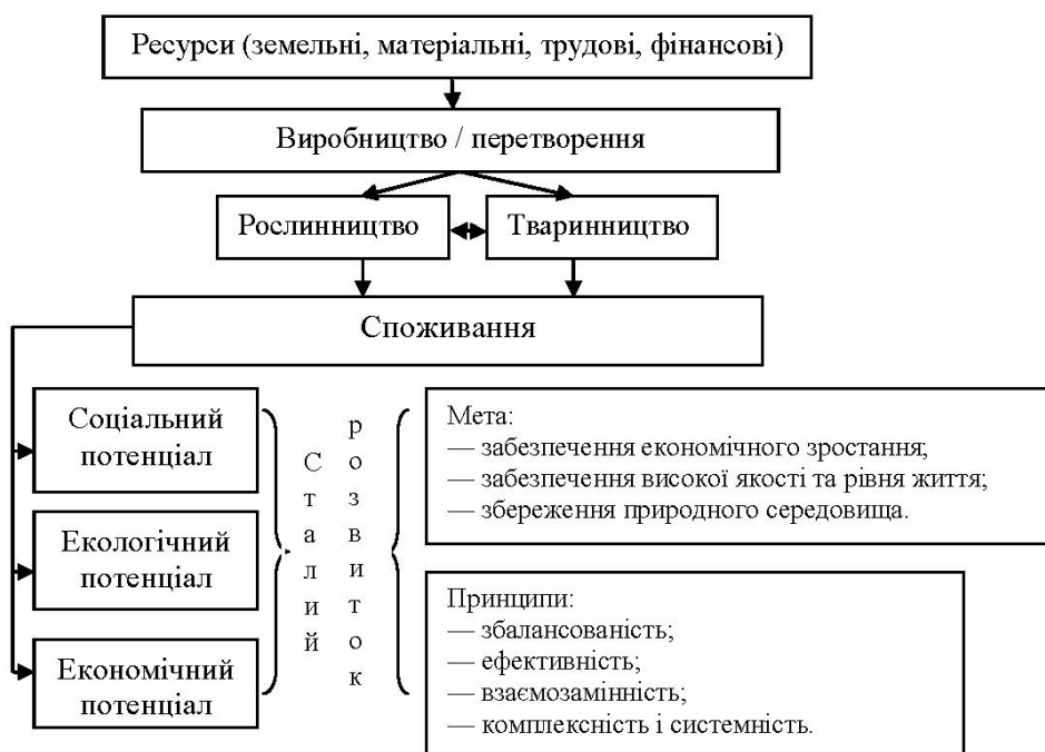
Рис. 1. Структура взаємопов'язаних галузей в аграрному секторі України

Інституціональність сукупного економічного потенціалу агропромислового підприємства виражається в тому, що його потенціал формується, використовується та розвивається з урахуванням правил, які розроблені інститутами, а склад і структура сукупного потенціалу кожного агропідприємства та визначається його особливостями як соціального, правового й ринкового інституту та функціонує в правовому полі, орієнтується на використання потенційних можливостей, що відкриваються ринковою економікою, і керується у своїй діяльності принципами соціальної корисності.