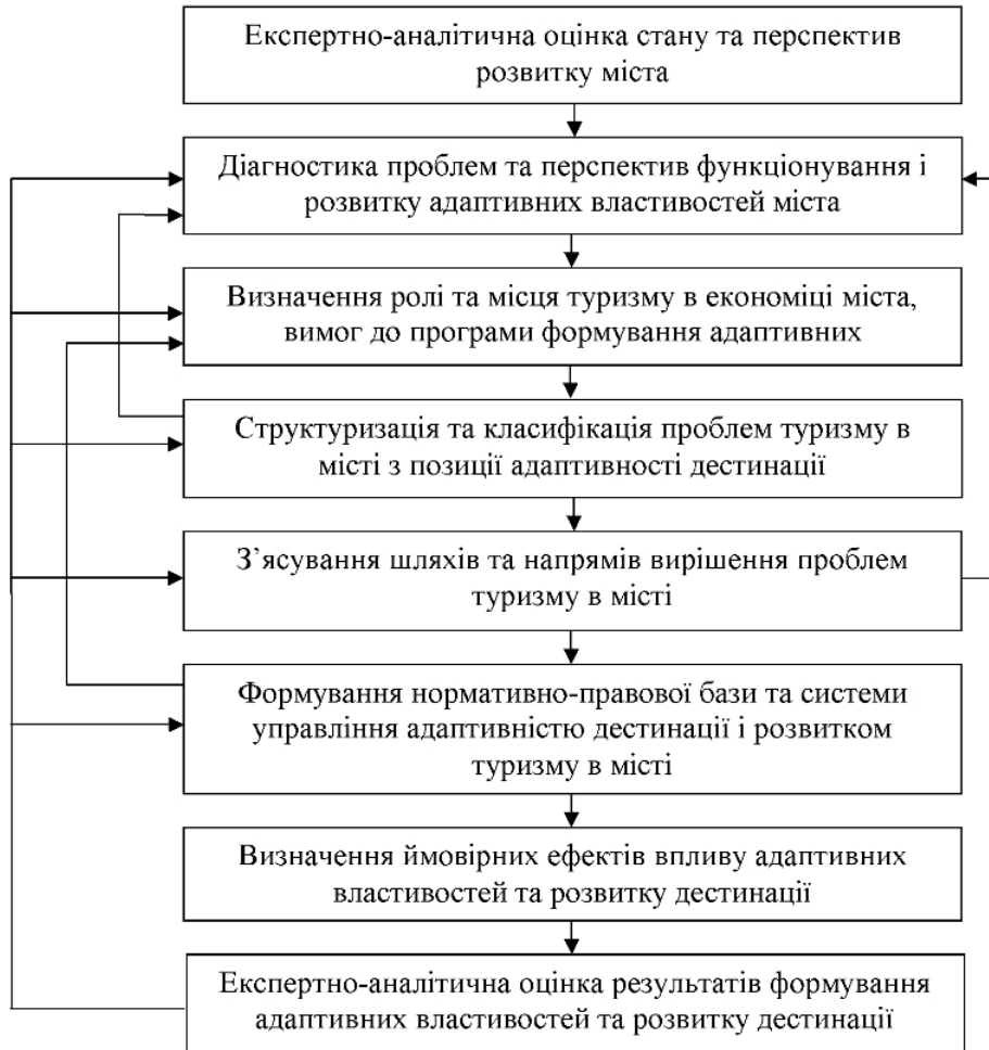
Рис. 2. Алгоритм формування адаптивності міської дестинації

Таким чином, організаційно-економічний механізм адаптації має значно ширший спектр функцій, ніж просто пристосування, і включає в себе: