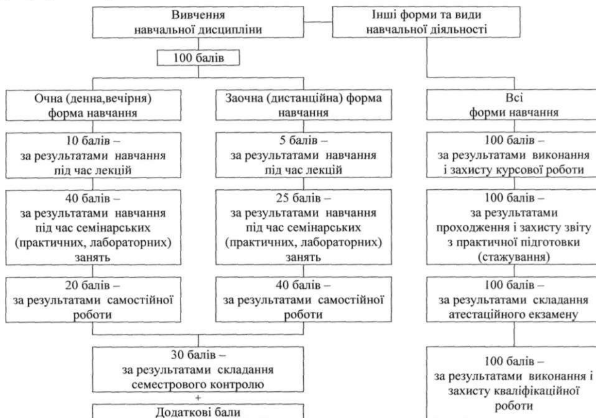
Рис. 4.1. Схема нарахування балів студентам за результатами навчання

Нарахування студентам балів за результатами навчання здійснюється за наведеною на рис. 4.1 схемою, яка визначає максимально можливу кількість балів на підставі результатів навчання за формами навчання, освітнього процесу і контролю.