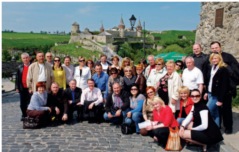
2008р., м. Кам'янець-Подільський. Міжнародний управлінський форум «Управління сьогодні та завтра»