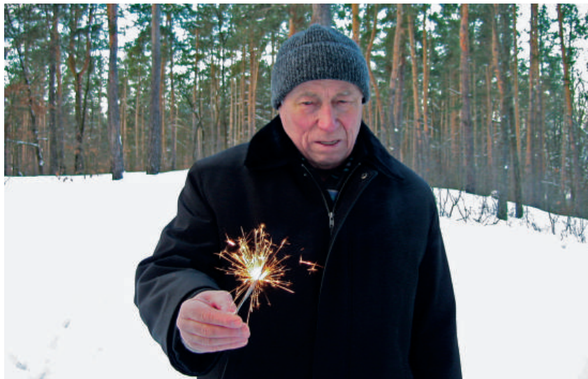
2009 р., м. Київ. Запалимо радість!!!