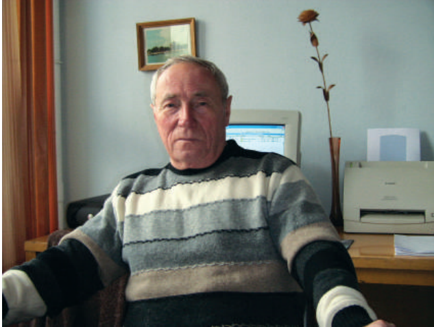
2006 р., м. Київ. Науково-дослідний економічний інститут. Робоче місце