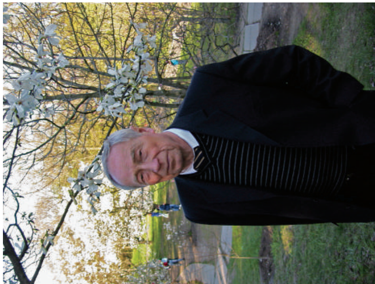
2010 р., м. Київ. Є така традиція: кожної весни спостерігаєи цвітіння магнолій