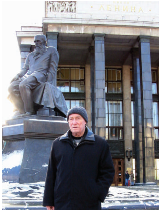
2006 р., м. Москва. Бібліотека ім. В. І. Леніна, в фондах якої знаходяться дисертації та автореферати Василя Івановича. Альма-матер кличе...