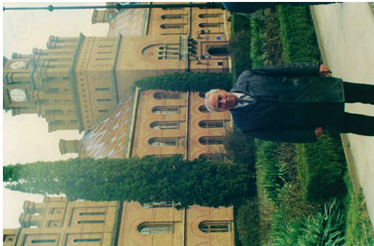
2001 р., м. Чернівці. На конференції у Чернівецькому державному університеті