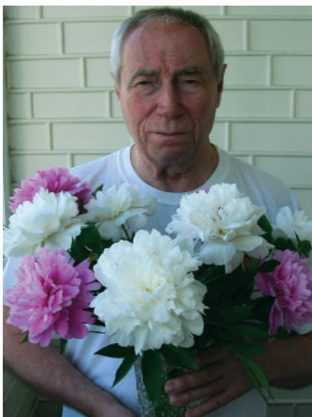
2008 р., м. Київ. Квіти з власної дачі