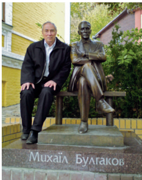
2008 р., м. Київ. Два великих мислителі...