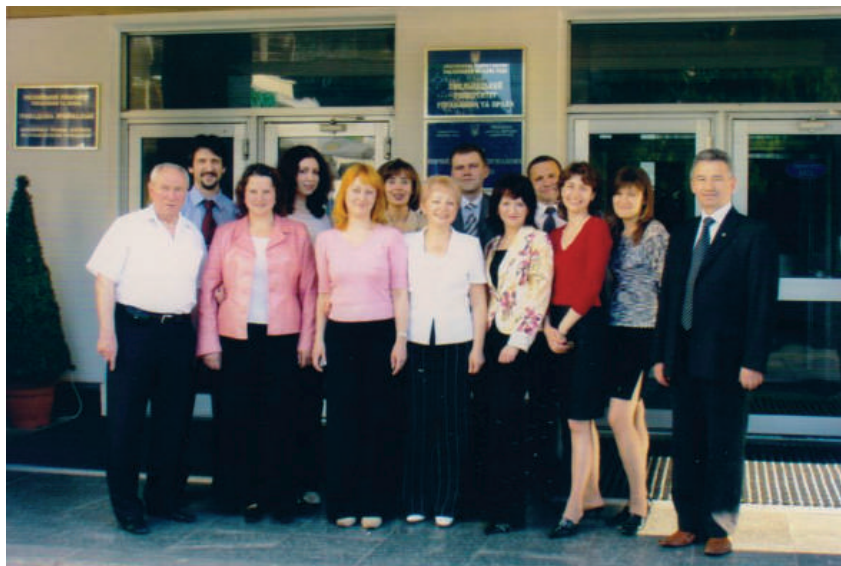
2005 р., м. Хмельницький. Ми дружна велика родина!!!