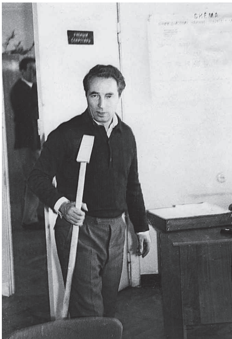
1973 р., м. Київ. Суботник в кімнаті вченого секретаря