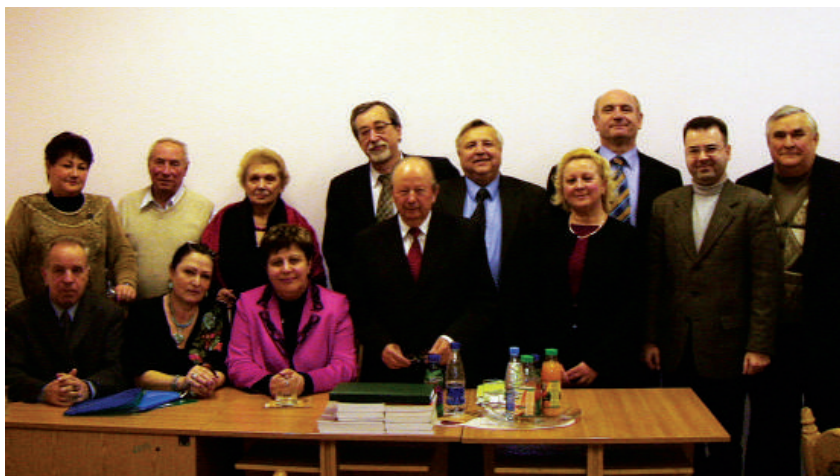
2007 р., м. Київ. Науково-дослідний економічний інститут. Засідання спеціалізованої Вченої ради Д.26.801.01