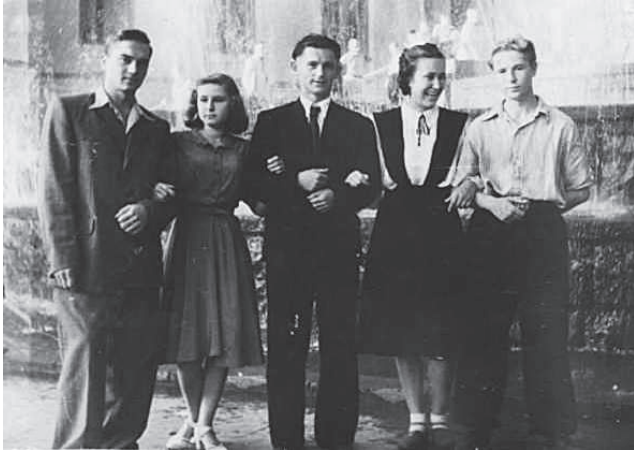
1950 р., м. Київ. Студенти КПІ та Лісогосподарського інституту