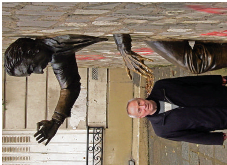
2007 р., м. Париж. Відоме скульптурне творіння Жана Маре. І навчилися ж люди крізь стіни проходити!!!