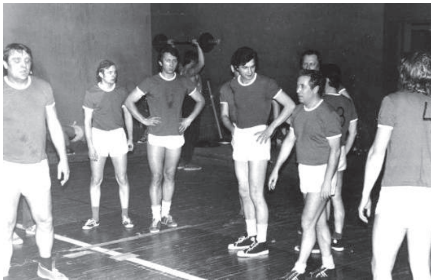
Завершилась баскетбольна гра між командами НДЕІ та Обчислювального Центру Держплану УРСР