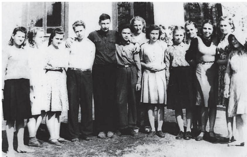
1950 р., м. Чернігів. Фельдшерсько-акушерська школа, 1 курс