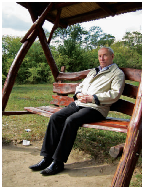
2009 р., м. Київ. Хто добре працює, той добре і відпочиває!