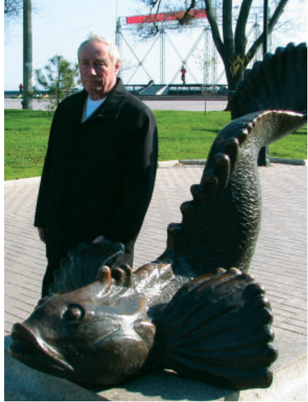
2006 р., м. Бердянськ та його символи. Не кожному у житті вдається упіймати ТАКУ золоту рибку!