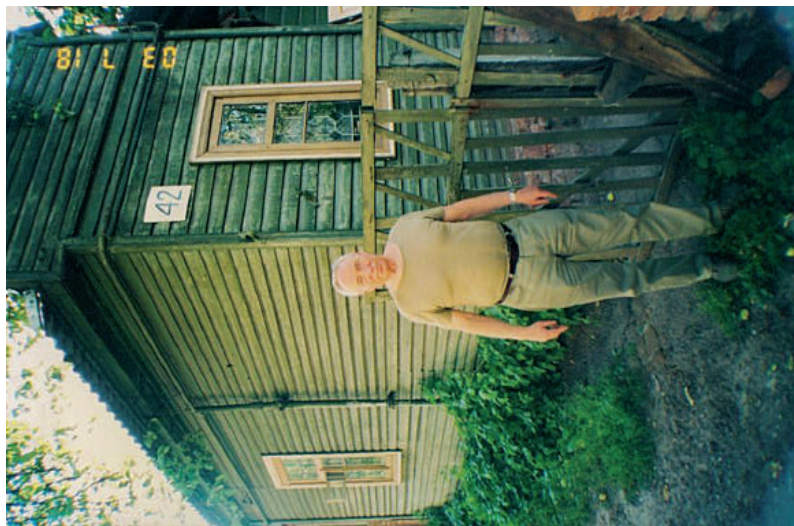
2003 р., м. Чернігів. Рідна хата