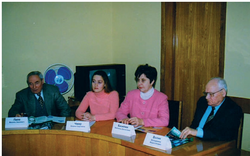
1997 р., м. Кременчук, Полтавська обл. Робоча нарада