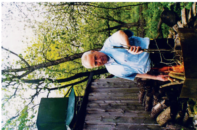
2004 р. Відпочинок на дачі...