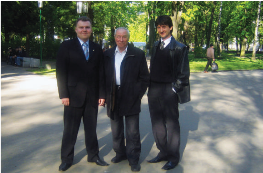
2007 р., м. Хмельницький. «Три богатирі»