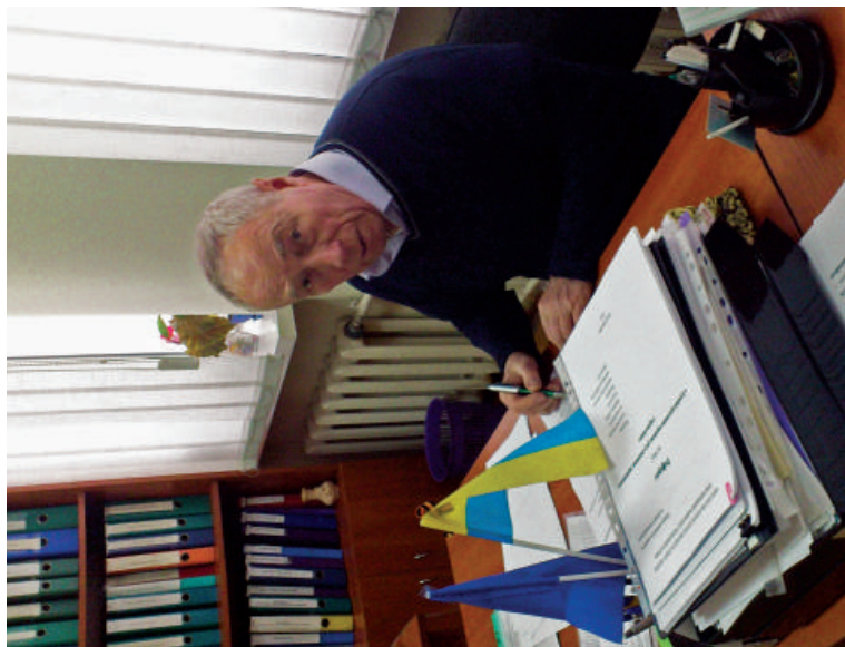
2011 р., м. Хмельницький. На рідній кафедрі завжди є робота!