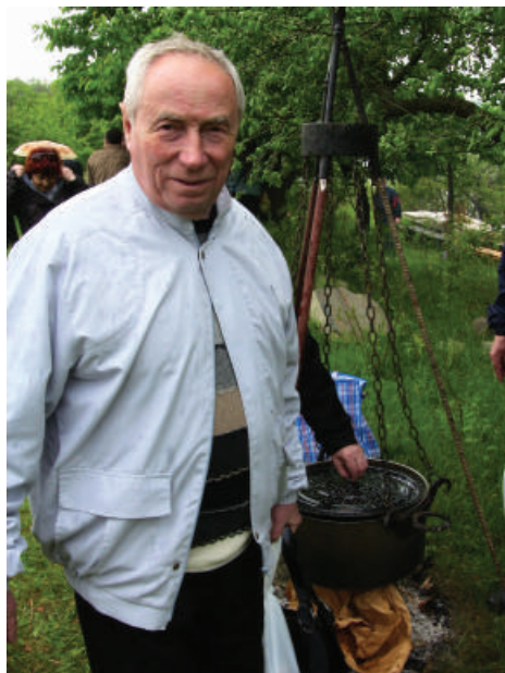
2008 р., м. Хмельницький. Як я люблю юшку!!!