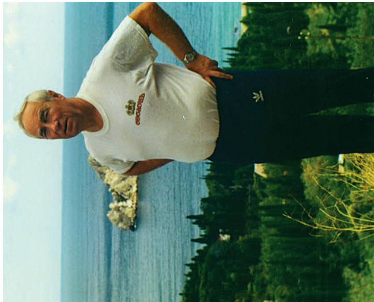
1999 р., м. Ялта. Як добре відпочивати...