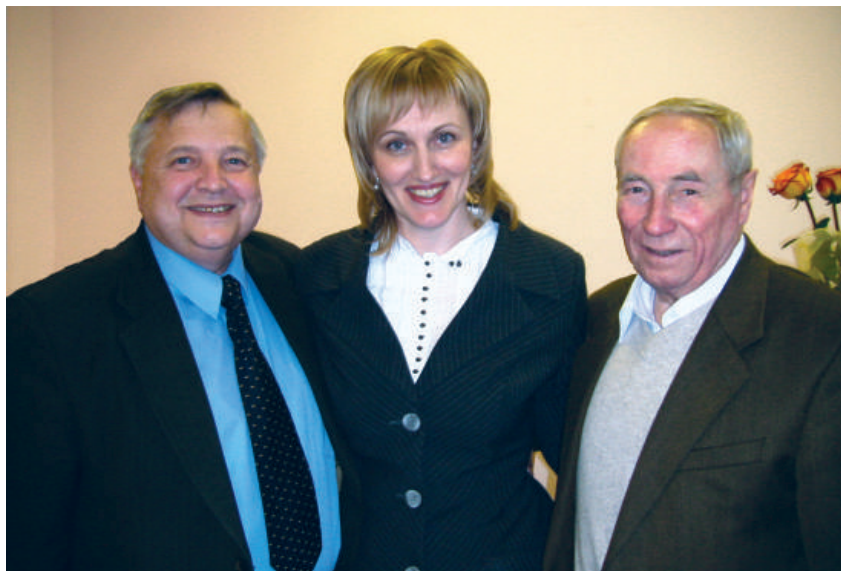
2007 р., м. Київ. Науково-дослідний економічний інститут. З колегами на засіданні спеціалізованої Вченої ради Д.26.801.01