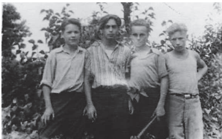
1946 р., м. Чернігів. Приятелі з вул. Леніна