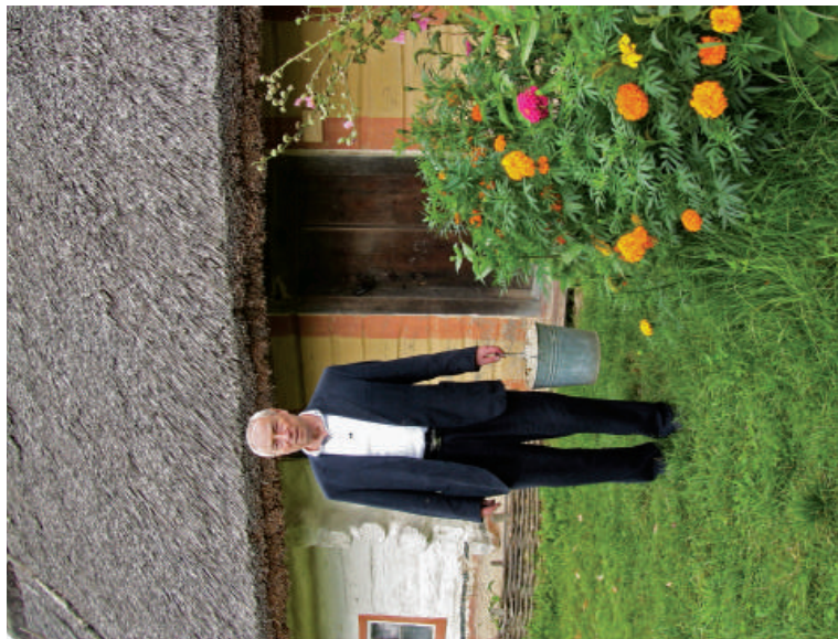
2011 р., м. Київ. Садок вишневий коло хати...