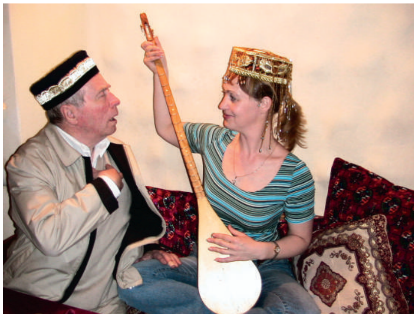
2006 р., м. Хмельницький. Музичні вправи