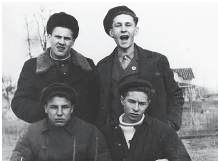
1949 р., м. Чернігів. Основні гравці збірної з баскетболу м. Чернігова