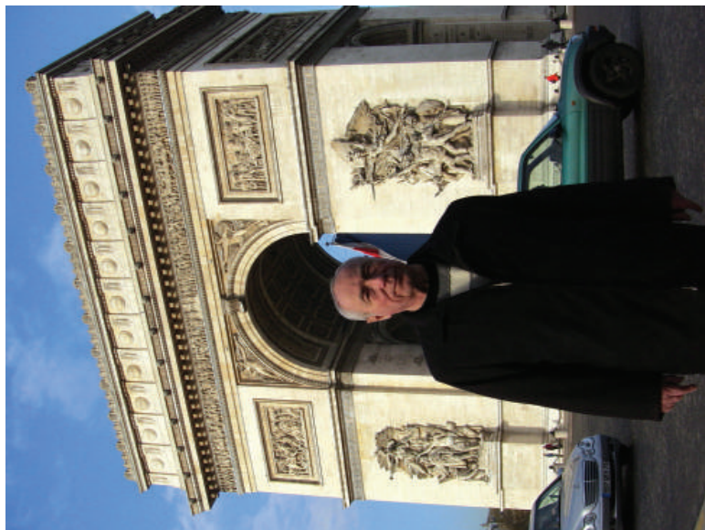
2007 р., м. Париж. Тріумфальна арка. Оце так побудували!!