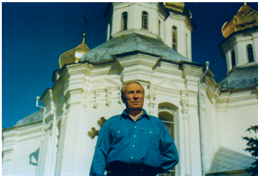
1996 р., м. Чернігів. Рідне місто