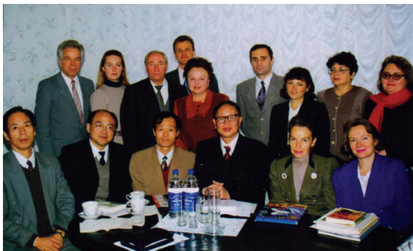
1998 р., м. Київ. Зустріч з делегацією з Китайської Народної Республіки у Київському торговельно-економічному університеті